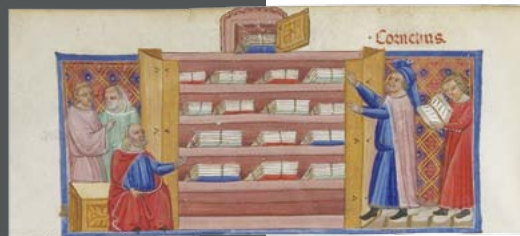
Le Roman de Troie, par « BENEVOIT DE SAINTE MORE », Bibliothèque nationale de France, Département des manuscrits, Français 782

Véritable vitrine du patrimoine écrit, graphique et littéraire des Hauts-de-France , ce portail rend accessibles et visibles les trésors conservés dans les fonds patrimoniaux .